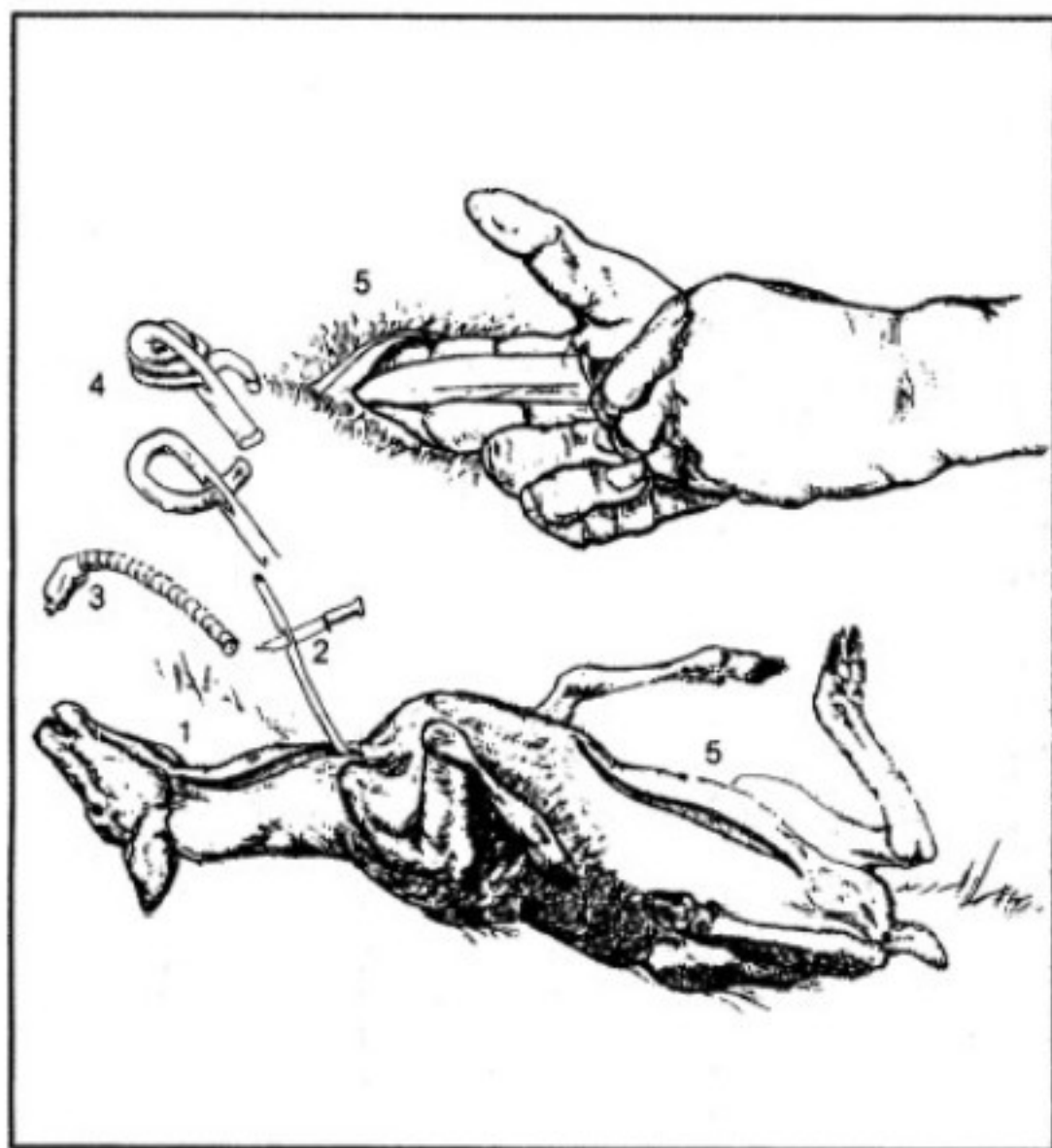
Fig. 5 - 1) Tagliare la gola; 2) Staccare trachea e esofago; 3) Tagliare la trachea; 4) Annodare l'esofago alla sua estremità; 5) Aprire la parete addominale con l'aiuto dell'indice e dei medio della mano sinistra per non ferire le interiora.

se il selvatico non è caduto sul posto, ci si allontanerà dalla zona dello sparo avendo cura di lasciare il binocolo puntato in direzione del bersaglio, cercando di ricordare di come ha reagito al colpo. Giunti sul luogo del bersaglio ispezionare con cautela nel raggio di circa 50 metri, facendo attenzione ai segni come frammenti di pelle o di ossa, pelo, sangue ecc. Se dopo una breve ricerca non trovi nelle vicinanze l'animale morto o ferito, marca il luogo e ritirati evitando di calpestare le tracce. Contatta immediatamente il conduttore del cane da traccia. All'imbrunire rimanda la ricerca al giorno dopo, un eventuale pioggia notturna non menoma la capacità olfattiva del cane.