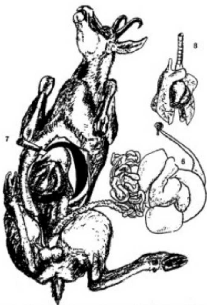
Fig. 6 - 6 Prendere l'esofago presso il diaframma al di sopra del ruminale, tirare e mettere da una parte le interiora incluso il ruminale. 7) Tagliare il diaframma lungo le costole, togliere il fegato e allontanare accuratamente il fiele nel camoscio e nello stambecco: 8) Levare trachea, polmoni e cuore.

Fig. 7 - 9) Tagliare attorno all'ano e alla vagina;